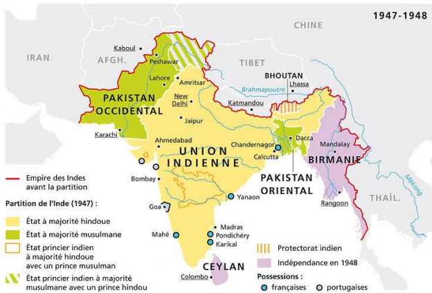
Les colonies britanniques et la partition de l'Inde